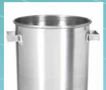
▲ Eventbehälter aus Aluminium, stapelbar