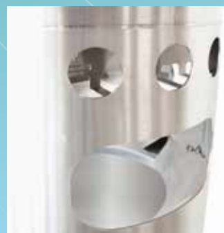
▲ Aschenbecher Fronteinwurf