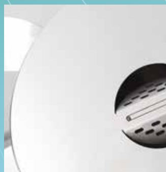
▲ Aschenbecher oben