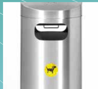
▲ Abfallbehälter mit Hundekotbeuteldispenser