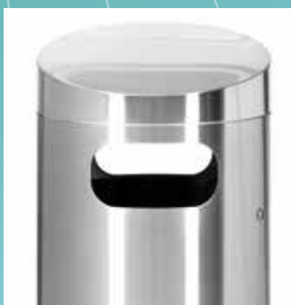
▲ Abfallbehälter ohne Aschenbecher