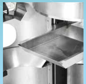
▲ Aschenbecher einfache Leerung