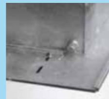
▲ Protection contre la sous-pression pour eau souterraine