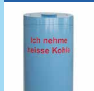
▲ Charbon chaud