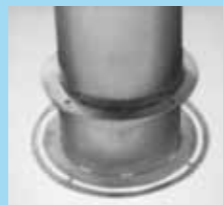
▲ Colonne d'introduction démontable avec plaque d'obturation