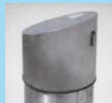
▲ Couvercle verrouillable