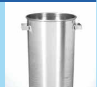
▲ Poubelle pour manifestations