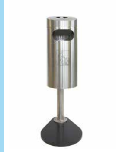
▲ Montage mural ou sur poteau