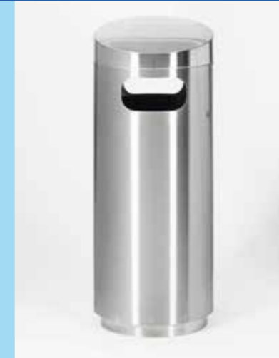
▲ Pose libre