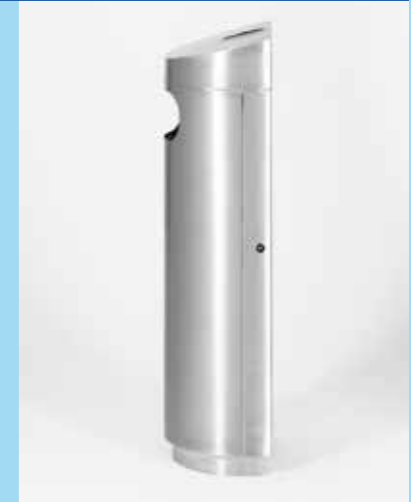
▲ Montage mural

L'assortiment Clean City propose des poubelles esthétiques en acier inoxydable pouvant toutes être complétées par des accessoires utiles.