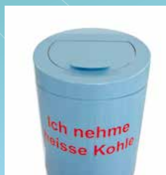
▲ Fermeture hermétique