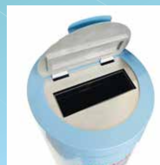
▲ Clapet d'ouverture