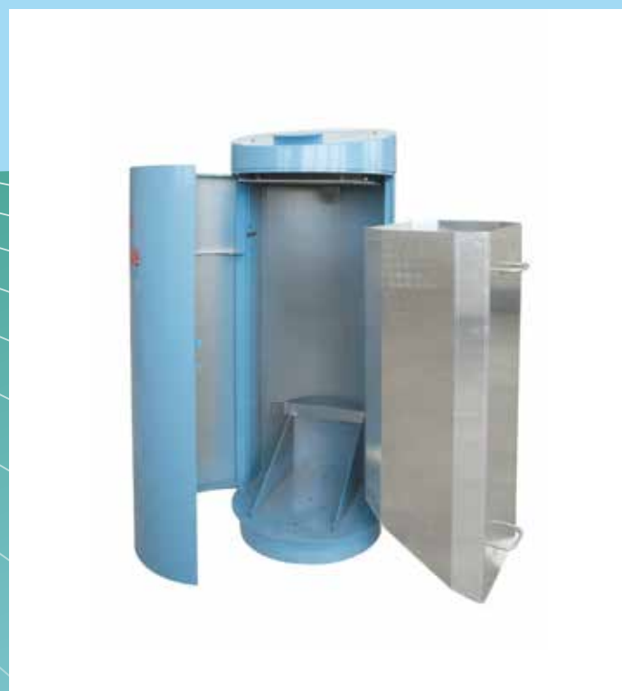
▲ Réceptacle interne en aluminium