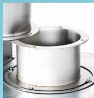
▲ Colonne d'introduction démontable