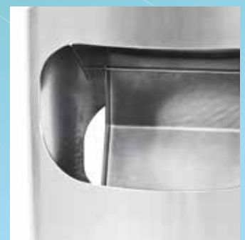
▲ Cendrier basculant à l'intérieur de la colonne d'introduction