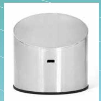
▲ Couvercle verrouillable pour colonne d'introduction